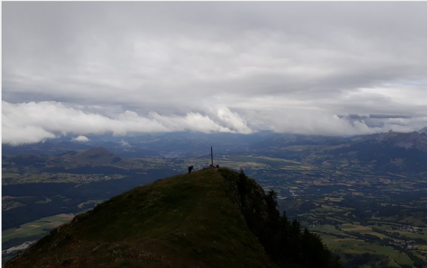
Le Palastre