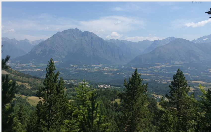
Vue depuis le sentier Dominique-Villars