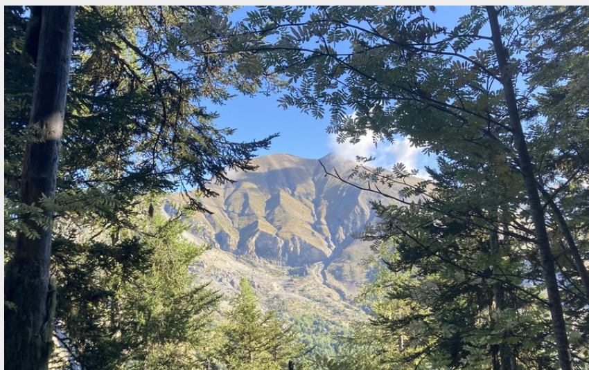
Sur le sentier