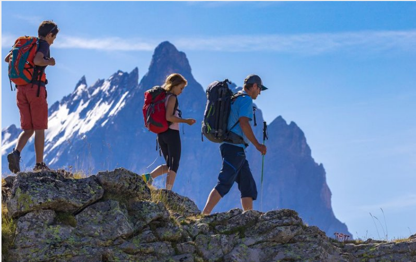
Plateau d'Emparis