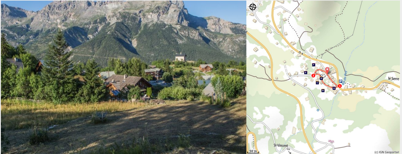
Puy St Vincent

Si l'on appelait les gens de la commune les «Traversourires», c'est que leurs habitations, agencées en une série de petits hameaux, s'accrochent à la pente et tracent des rues à flanc de «puy». On dit ici qu'on «traverse» pour passer d'un hameau à l'autre.